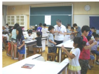
【ブンブンごま作り】