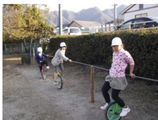
【一輪車で仲良く遊ぶ】