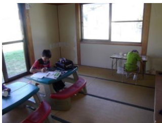
【真面目に学習に取り組む】