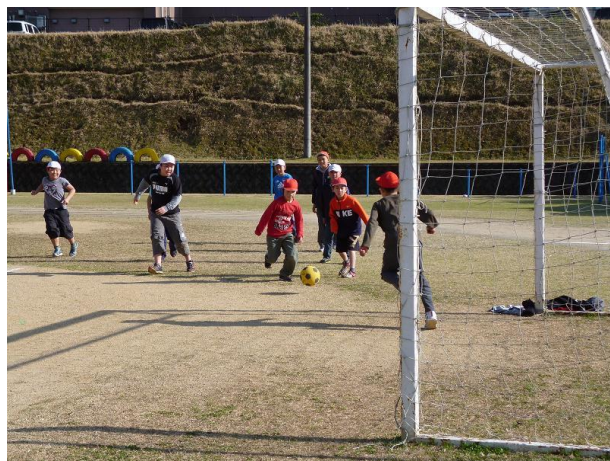
【外でサッカーをして遊ぶ様子】