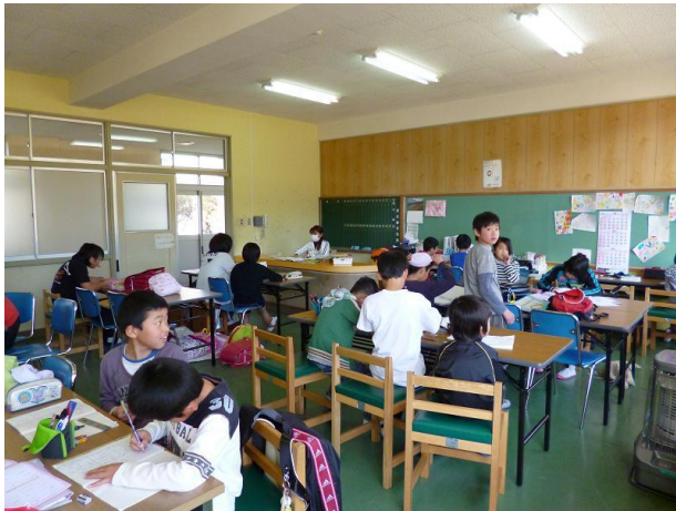
【来室後、勉強をしている様子】