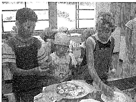
夏休みのピザ作りの様子