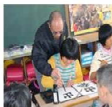
【書写指導の様子(魂沖野小)】