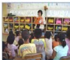
【読み聞かせの様子(休藤小)】