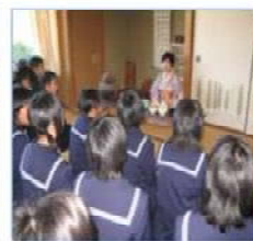
【礼法指導の様子(休藤中)】