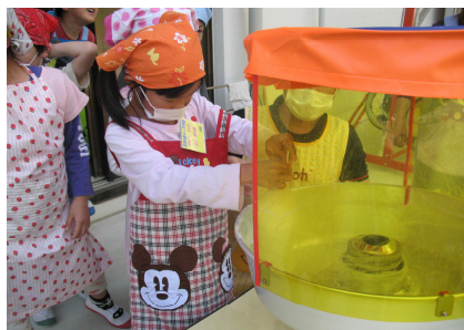
【わたがし作り体験】