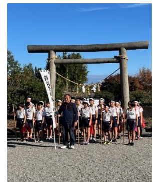
【棒おどり奉納】 ～地域指導者と児童～