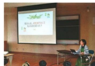
【地域おこし協力隊の講演】