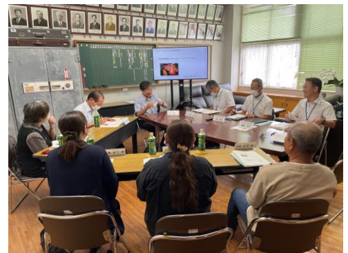
【三股小の子どもについて語る会】

学校運営協議会を中心として、保護者、地域の方々、学校の関係者を委員に、一堂に会し、熟議を行い、そのなかで、共通の目標づくりや、出てきた意見、まとまった意見を、校長、あるいは、教育委員会に伝えて、活動を整理し、重なりや負担感がない、効果的な活動にしていきます。この学校運営協議会制度を実施している学校が、いわゆる、コミュニティ・スクールであり、令和5年度は、県内3町で本事業が実施されました。