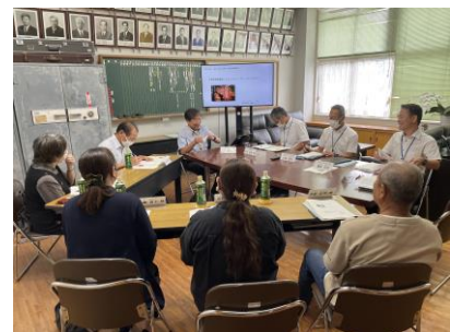
【三股小の子どもについて語る会】