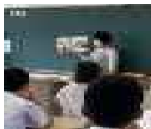
【読み聞かせの様子】