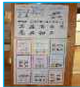
【校長室の前に貼ったかべ新聞】

・学校の行事や、出来事などを「にししな TIMES」に載せ、はげまし隊員に1号～20号を郵送しました。はげまし隊の皆さんも楽しみにしてくれているようです。