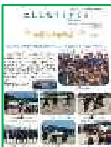
【にししな TIMES 14号】