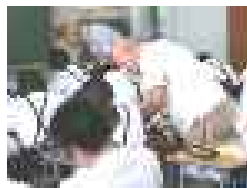
【さりげなく よりそい】