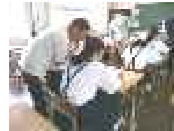
【やさしく はげます】