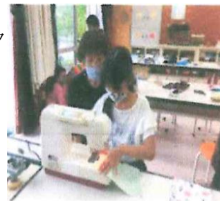
【マスク作り挑戦中】