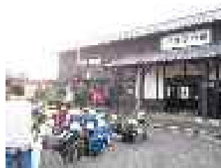
【えびの駅での講話の様子】