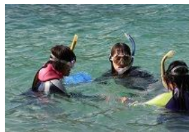
【着衣泳・シュノーケル体験】