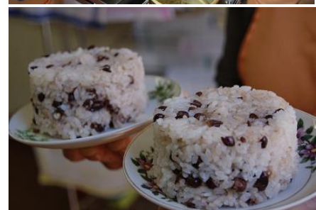
【ふるさとの食文化伝統料理教室】