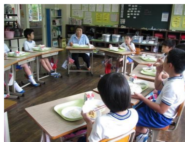
【ほのぼのの学級生との交流】