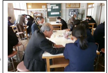
【はげましタイムの様子】