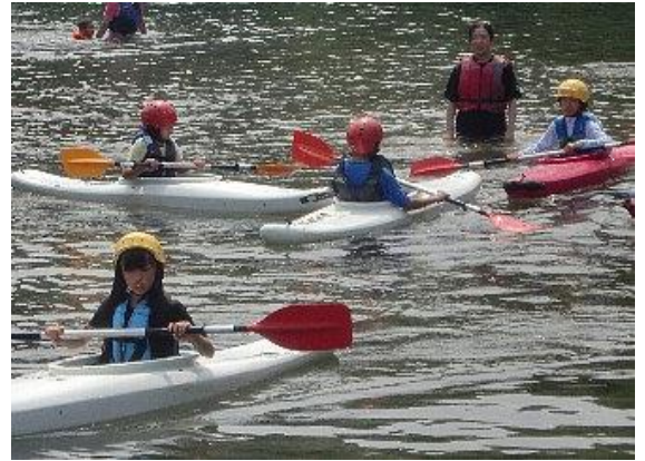
【カヌー体験（三股町）】